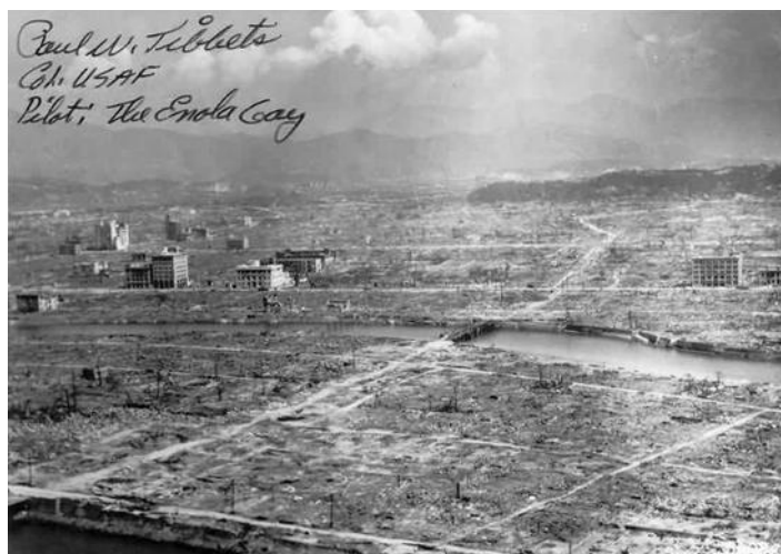
La città di Hiroshima è stata quasi completamente distrutta dalla bomba atomica