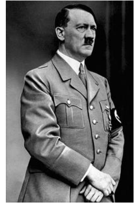
Hitler comandava in Germania

All'inizio della guerra la Germania sembra imbattibile.