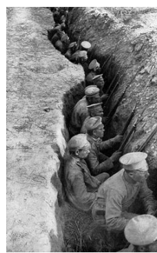
Soldati nascosti nella trincea