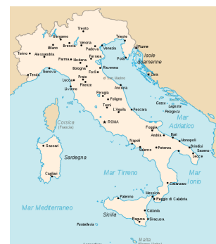
e dopo la conquista del Trentino-alto Adige