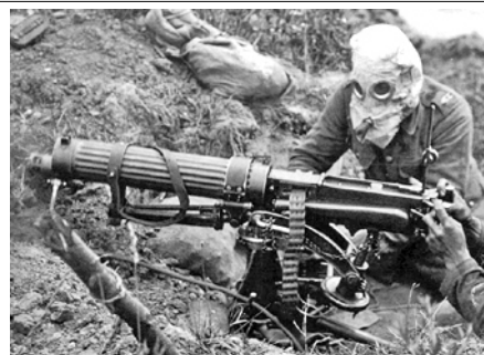
Gas velenosi (i soldati dovevano usare maschere anti-gas)