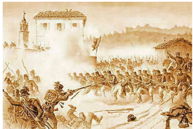
Il popolo si ribella e scoppiano molte rivoluzioni (guerre contro i re)