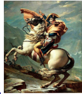
Napoleone viene battuto

Gli stati europei (Francia, Austria, Spagna, ecc...) fanno il Congresso di Vienna . Decidono di annullare tutto quello che ha fatto Napoleone e di riportare tutto come era prima della Rivoluzione Francese. Tutti i re dovevano tornare al loro posto.