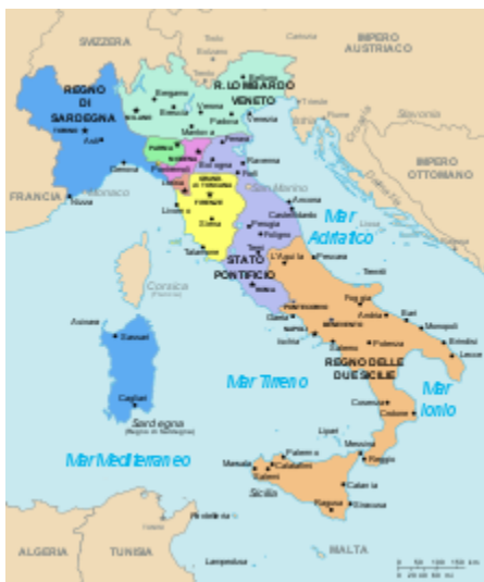
L'Italia viene divisa in tanti piccoli stati