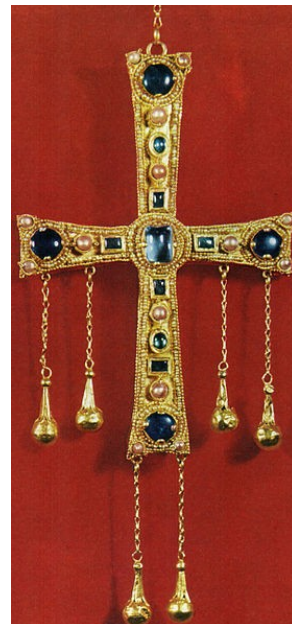
I longobardi diventano cristiani

- Se un longobardo avrà tramato contro la vita del re sia condannato a morte e i suoi beni siano confiscati