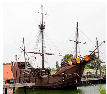
Una copia della Santa Maria