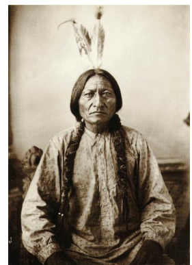
Gli indiani vengono sterminati e obbligati a vivere nelle riserve