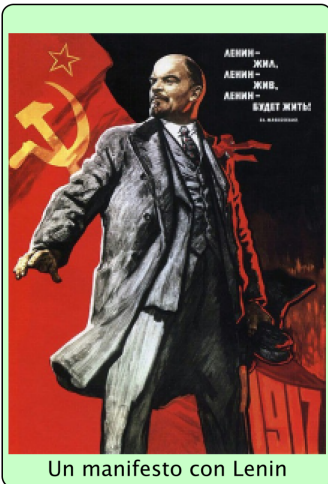
Un manifesto con Lenin