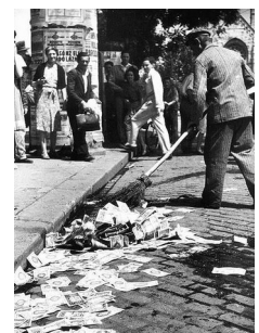
le banconote non valgono nulla