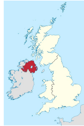
Nel 1922 l'Irlanda diventa indipendente, ma l'Irlanda del Nord rimane con la Gran Bretagna

Nasce il Commonwealth: è l'unione di tutte le colonie della Gran Bretagna. Ogni stato ha il suo governo, ma il capo di stato rimane il re d'Inghilterra.