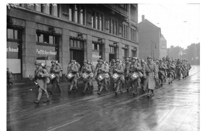
La Francia invade la regione tedesca della Ruhr

Anche la Francia era in crisi. I campi rovinati dalla guerra producevano poco cibo. La Francia pretende allora dalla Germania il pagamento dei debiti di guerra. Per obbligare la Germania al pagamento dei debiti di guerra la Francia invade la regione tedesca della Ruhr , ricca di giacimenti minerali e industrie. Questa invasione ha aumentato ancora di più l'odio dei tedeschi verso la Francia. I soldati francesi si ritireranno dopo due anni, nel 1925.