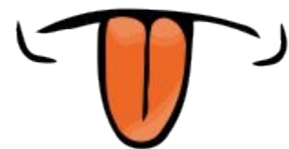
L'olfatto collabora con il senso del gusto