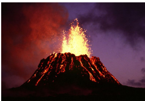
Eruzione con lava

Vulcani italiani: Vesuvio, Etna, Stromboli