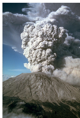
Eruzione con fumo e cenere