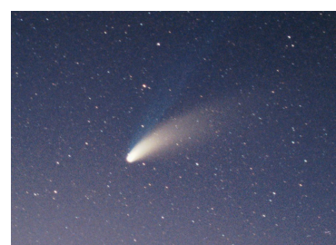
Cometa (puoi vedere la coda luminosa)

Le comete sono fatte di ghiaccio e sono molto piccole. Quando le vedi in cielo hanno una coda luminosa.