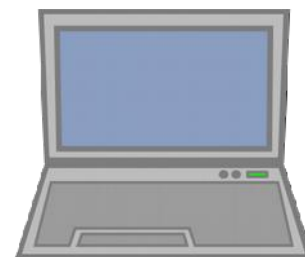
grazie a Internet puoi sapere cosa succede nel mondo

Grazie a Internet puoi sapere cosa succede nel mondo.