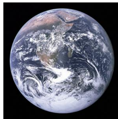
La Terra = il globo = il mondo