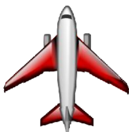
Le persone viaggiano