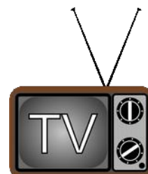
Molti oggetti sono prodotti in Cina

Gli oggetti poi vengono caricati su delle navi che li portano da noi in Italia.