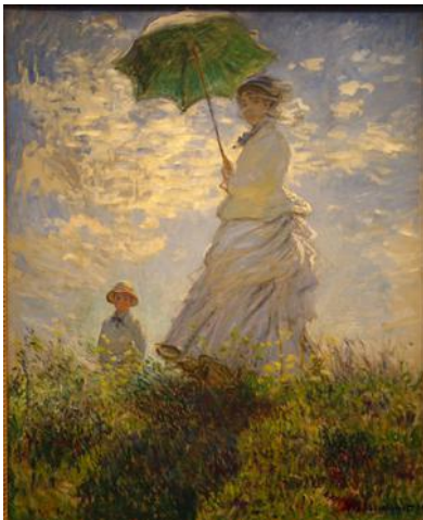
Monet, la passeggiata

Guarda questo quadro: i contorni sono sfumati, non sono precisi.