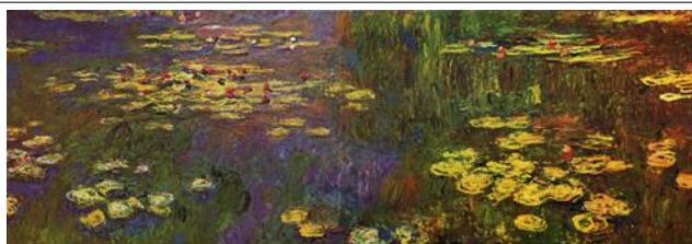
Claude Monet, ninfee

Gli impressionisti dipingevano all'aria aperta.