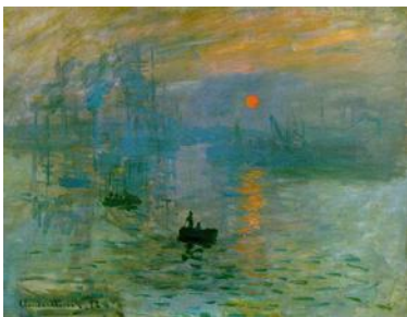
Monet, Impression, soleil levant

Dopo invece hanno molto successo. Fanno delle mostre con soli quadri impressionisti.