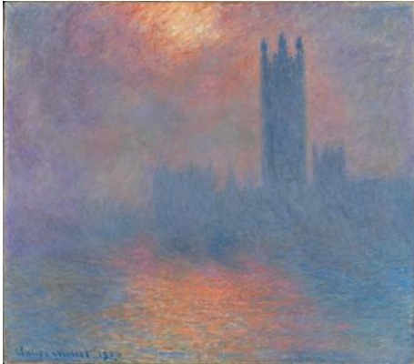
Monet, il Parlamento di Londra

Guarda la ballerina: sembra che la luce esca dal suo corpo.