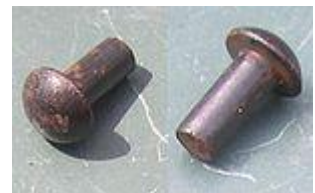
rivetti (servono per tenere unite le parti della torre)