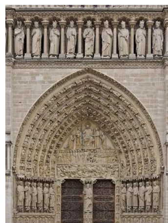
Sulla facciata ci sono molte statue