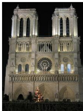
Notre Dame di notte