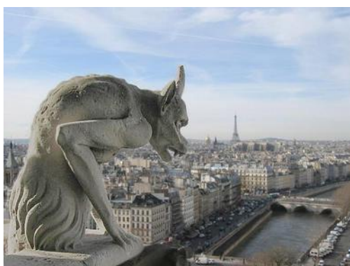
Statua di un gargouille