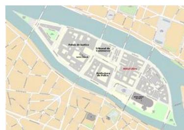
Notre Dame si trova su un'isola chiamata Île de la Cité