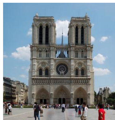
La Cattedrale di Notre Dame

Salendo al primo piano si possono vedere delle statue che rappresentano dei mostri: si chiamano gargouille.