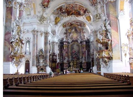
L'arte rococò è molto ricca di decorazioni